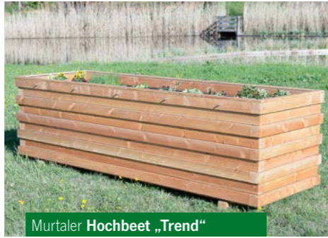
Murtaler Hochbeet „Trend“