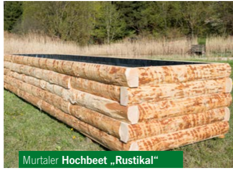
Murtaler Hochbeet „Rustikal“