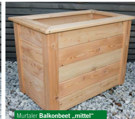
Murtaler Balkonbeet „mittel“