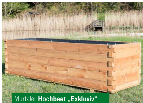
Murtaler Hochbeet „Exklusiv“