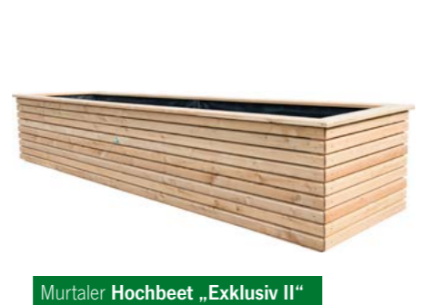
Murtaler Hochbeet „Exklusiv II“