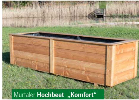
Murtaler Hochbeet „Komfort“

Wählen Sie aus fünf verschiedenen Modellen. Alle sind aus beständiger, steirischer Lärche gefertigt und ideal für Biogärten. Garantiert ökologisch. Garantiert aus dem Murtal.