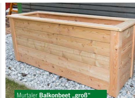
Murtaler Balkonbeet „groß“