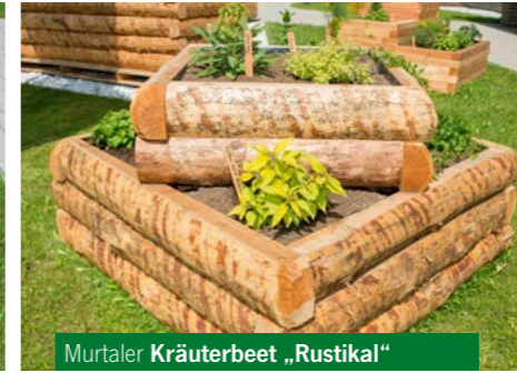
Murtaler Kräuterbeet „Rustikal“