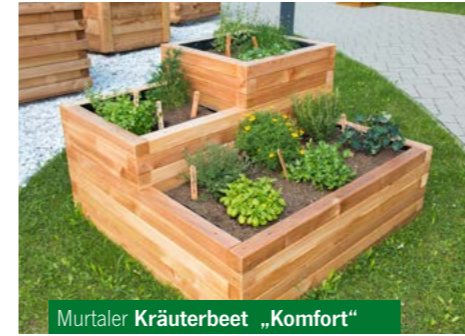
Murtaler Kräuterbeet „Komfort“

Für die Pflanzeerde verwenden Sie am Besten ein Gemisch aus Kalk, Sand und Humus.